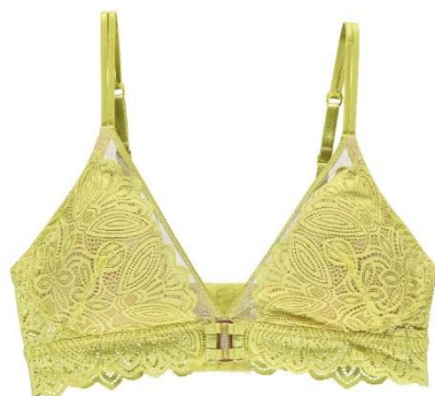
XS-XL CHF 99.90