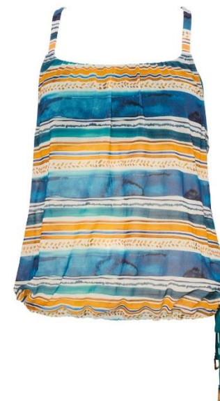
B/C 38-48 D/E 38-48 CHF 129.—