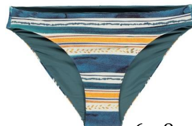
36-48 CHF 59.90