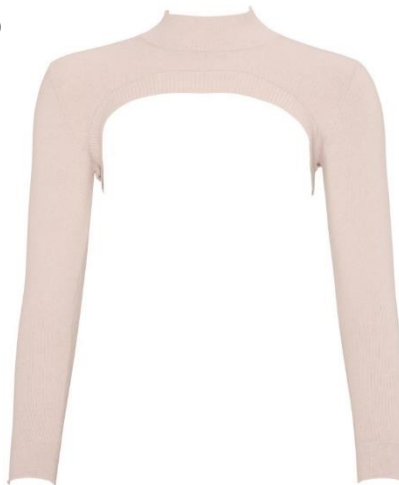
S-L CHF 99.90