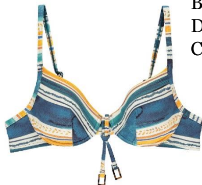
A 36-40 B-C 38-44 D 38-42 CHF 99.90