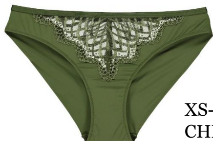
XS-XXL CHF 49.90