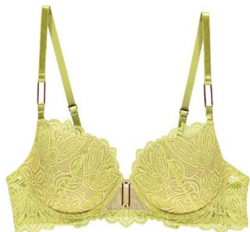
A75-80 B-D75-85 CHF 129.—