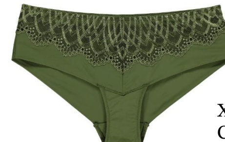
XS-XXL CHF 49.90