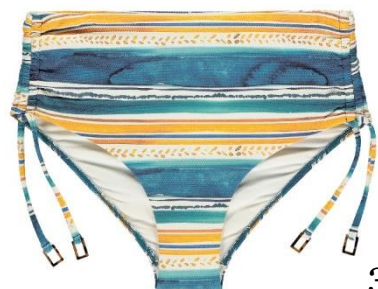
36-48 CHF 69.90