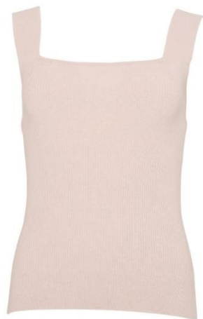
S-L CHF 99.90