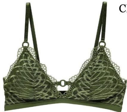
XS-XL CHF 119.—