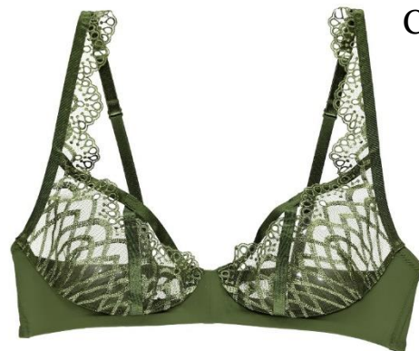
B-C 75-85 CHF 119.—