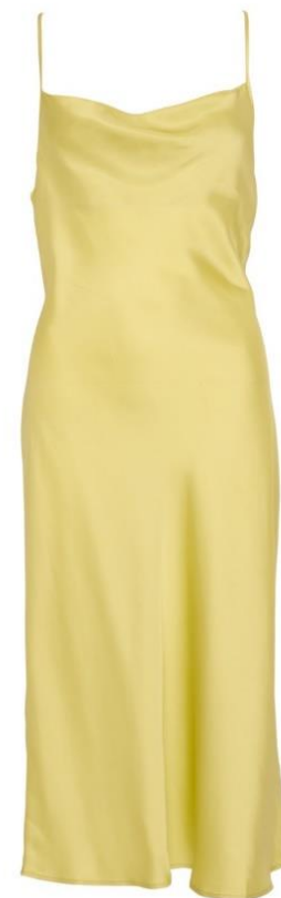
S-XL CHF 149.—