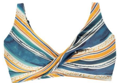
D-E 38-44 CHF 99.90