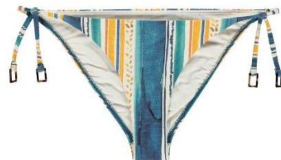
36-42 CHF 59.90