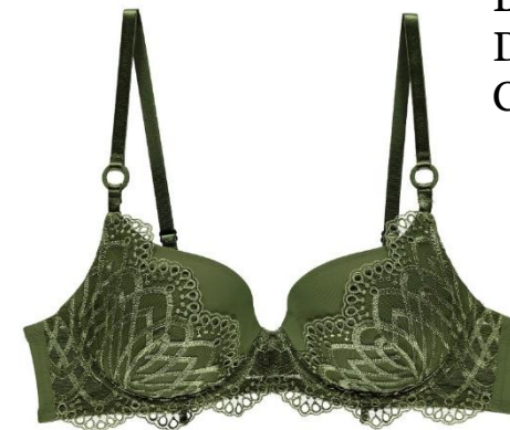
B-C 75-90 D-E 70-85 CHF 129.—