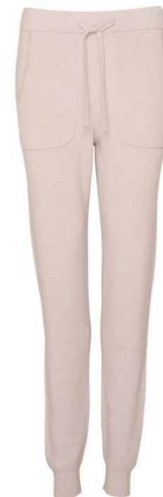
S-L CHF 139.—