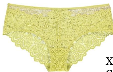
XS-XL CHF 44.90