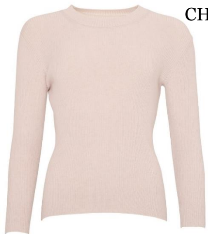
S-XL CHF 129.—