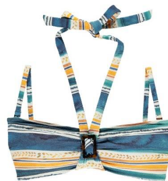
B-C 36-42 CHF 99.90