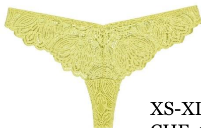
XS-XL CHF 44.90